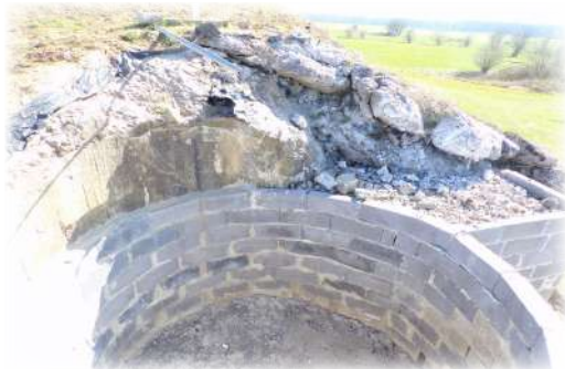
Chantier de la cloche Bloc 1

Mais le gros chantier commencé la première semaine de janvier est la reconstruction de la cloche arme mixte sur l'arrière du Bloc 1. Celui-ci est bien avancé et nous espérons qu'il sera terminé cette année.