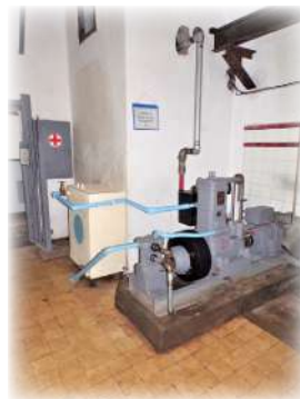
Le CLM à l'usine

Pendant ces 6 premiers mois, nous avons apporté des aménagements surtout dans le fond de l'ouvrage : montage de la tuyauterie sur le petit CLM, fabrication du support de l'éplucheuse à pommes de terre, aménagement de la réserve à vivres et diverses peintures au niveau de la cuisine et de l'usine ;